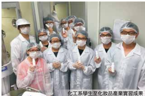
化工系學生至化妝品產業實習成果