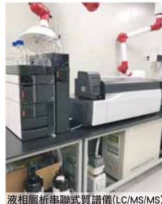
液相層析串聯式質譜儀(LC/MS/MS)